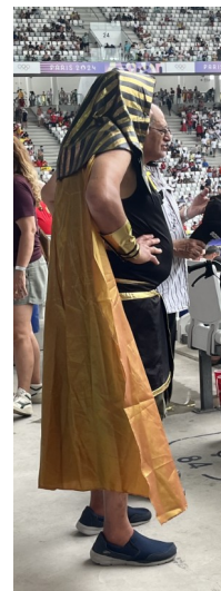
Toutânkhamon au Stade Matmut Atlantique !