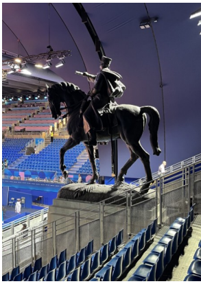
Le Maréchal Joffre aux premières loges !