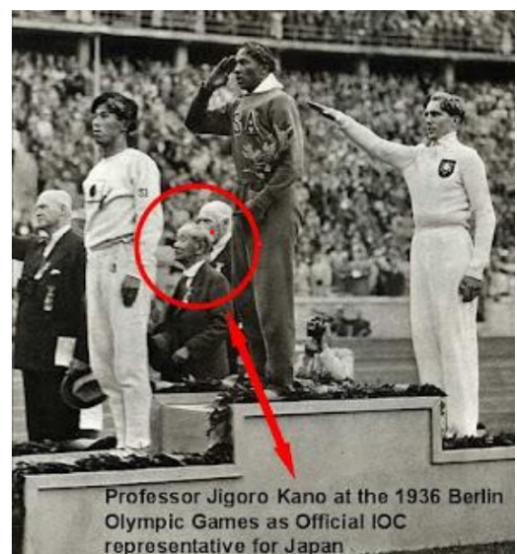
Professor Jigoro Kano at the 1936 Berlin Olympic Games as Official IOC representative for Japan

Kano est présent à ces jeux, comme le montre cette photo de la remise des médailles du saut en longueur.