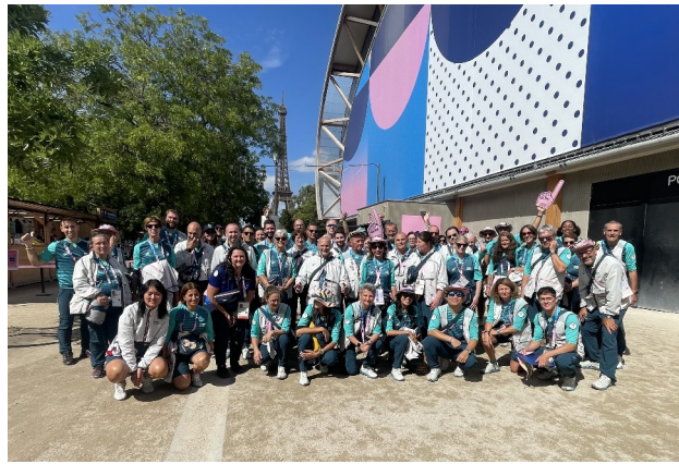
L'équipe « service aux spectateurs » de l'Aréna Champ-de-Mars pour les épreuves en matinée (une autre équipe assurait les épreuves débutant l'après-midi)