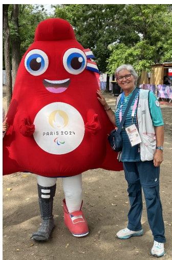
Avec la Phryge des jeux paralympiques

Si, au final, j'avais le sentiment du devoir accompli et d'avoir passé de bons moments, je restais toutefois un peu frustrée de n'avoir pas assez vibré au stade et de n'avoir pas ressenti de ferveur au sein de la ville même (le stade étant éloigné du centre). J'étais donc impatiente de "monter à la capitale" pour connaître l'effervescence... et je n'ai pas été déçue !