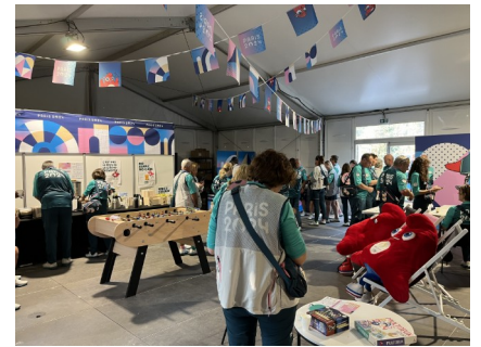
Un aperçu du « centre des volontaires » où étaient proposés des collations, des jeux, des écrans, des fauteuils...

Par ailleurs, mes horaires de mission m'ont laissé du temps libre pour redécouvrir l'impressionnant patrimoine parisien, pour admirer l'émouvante envolée de la majestueuse et féerique vasque, ou encore partager un moment avec des connaissances résidant sur place ou de passage... J'ai pu également assister à l'une des sessions de para-athlétisme au stade de France (où je mettais les pieds pour la première fois), grâce à un billet offert par « Paris 2024 » à tous les volontaires. Encore un moment incroyable !